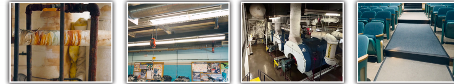
ESCUELAS SECUNDARIAS DEL DISTRITO 88: FUERTE POR FUERA, ENVEJECIENDO POR DENTRO.